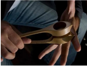
cuillères en bois

guimbarde – cuillères en bois – violon – accordéon – harmonica